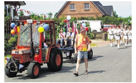
Einen Festumzug durch das Dorf gibt es am Sonnabend. AMI

Der Amtsausschuss beschloss die Sanierung der Sanitäranlage der Boy-Lornsen-Schule am Standort Tolk. Die 265 000 Euro teure Maßnahme wird mit 80 000 Euro vom Bildungsministerium gefördert. Den Rest teilen sich das Amt Südangeln und die Gemeinde Tolk. ql