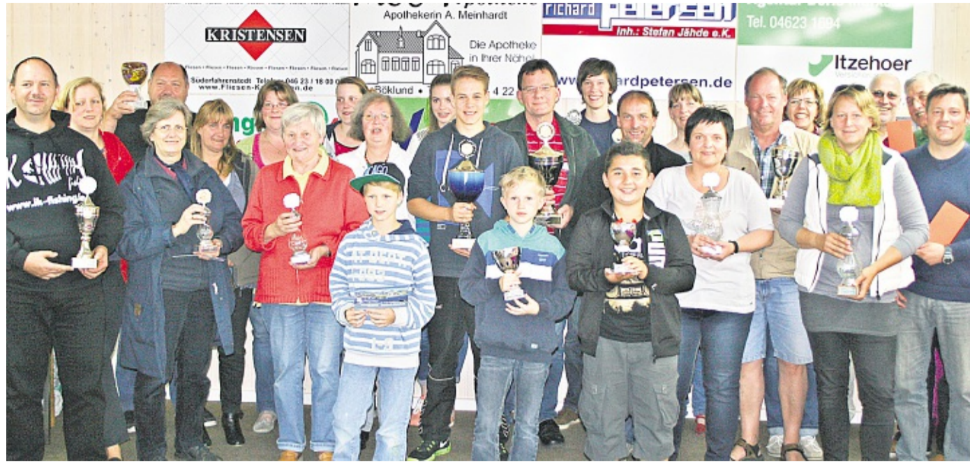
Stolz präsentieren die besten Schützen der Böklunder Veranstaltung ihre Pokale.