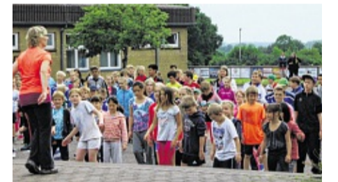
Vor dem Wettkampf wärmten sich die Schüler zunächst gemeinsam auf. HSZ

Die gesamte Lehrerschaft war sich einig: „Dank der großartigen Mithilfe der zahlreichen Eltern war der heutige Zehnkampf ein voller Erfolg. Ein wirklich toller Tag!“ hsz